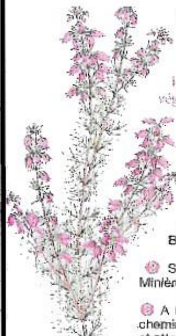
Bruyère cendrée. Dessin N.L.

Ce circuit parcourt une zone de landes et de pins caractéristiques de la plaine du Bélois dont la pauvreté du sol, sableux, limite le développement des espèces végétales.