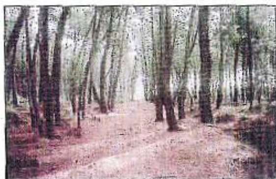
Chemin dans les landes du Bélois.

L'accès de folie de Charles VI Le Fou est situé quelque part dans les landes entre Guécélard et Parnigné-le-Pôlin le 5 août 1392. Un autre roi passa par là... enfin son cœur seulement. En effet, le cœur d'Henri IV séjourna une nuit dans l'église lors de son transfert vers la Flèche. Seule route existant à l'époque, le chemin aux bœufs est toujours praticable sur certaines portions. Une maison datant du XVIII e siècle, située rue du Vieux-Bourg, fut une auberge qui n'a pas dû laisser que de bons souvenirs puisque son enseigne portait le nom de Torchon Sale. Jusqu'à la fin du XIX e siècle, le seul